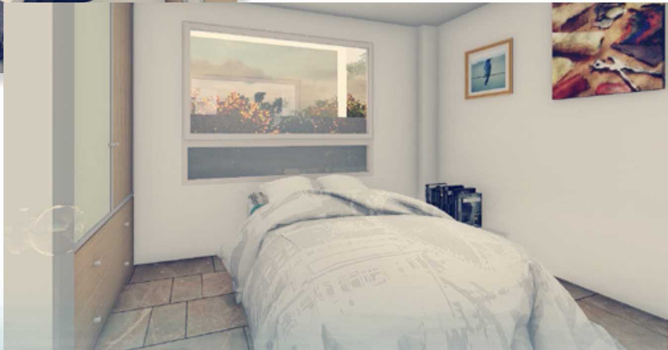
Dormitorio 2: 3,15m. x 2,94m.