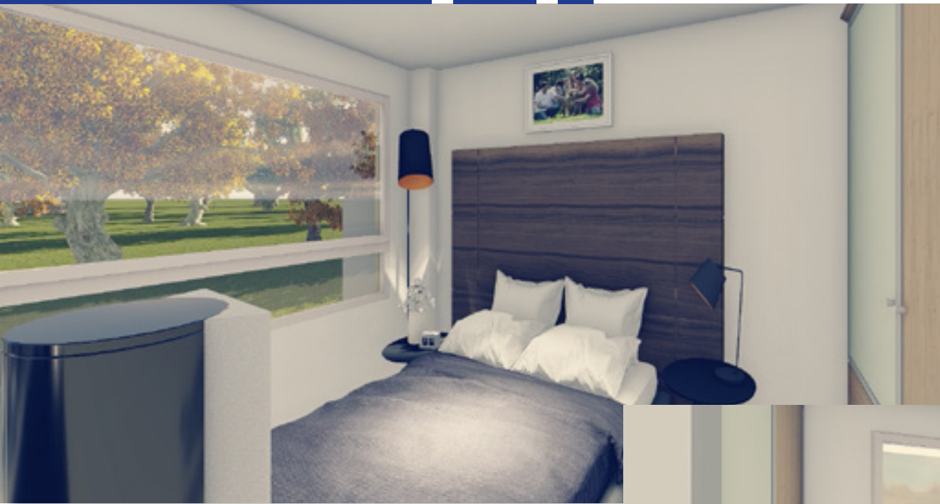
Dormitorio 1: 3,25m. x 2,85m.